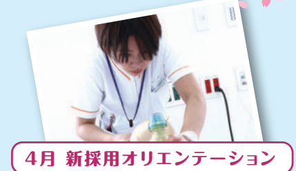
4月 新採用オリエンテーション