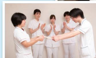
静脈内注射の認定証授与