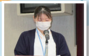
2月 リフレクション・看護観