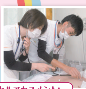
11月フィジカルアセスメント：特定行為研修終了者によるOJT