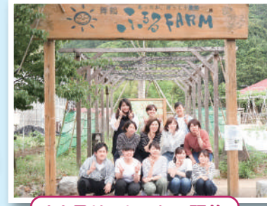
11月リフレッシュ研修