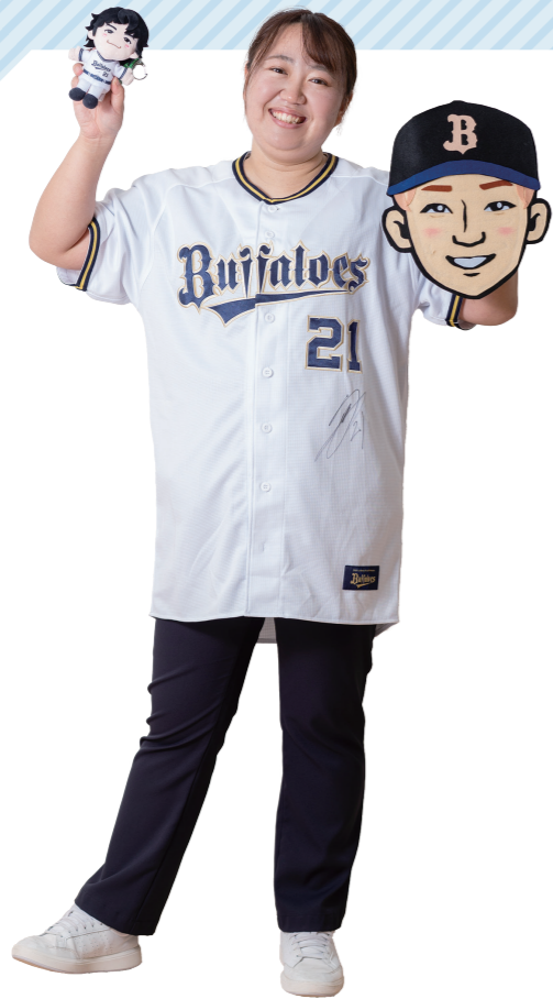
M.K | 兵庫あおの病院 2022年入職

オリックス・バファローズの大ファンです。夫や友人と月1回は必ず応援に行っています。プロ野球のシーズンオフには、毎年、高知、宮崎のキャンプまで推し活遠征に出かけます！いつも推しの選手に癒されています。