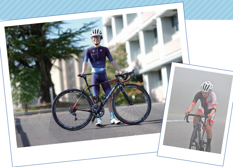
Y.I | 神戸医療センター 2019年入職

ロードバイクにハマっています。子供のころから乗っている延長でだんだんと本格的になってきました。普段は、チーム戦での競技のため、チームで練習を行なっています。なんといっても、スピード感と風を受けながら走る爽快感は最高で、気分転換と心身の健康に役立っています。